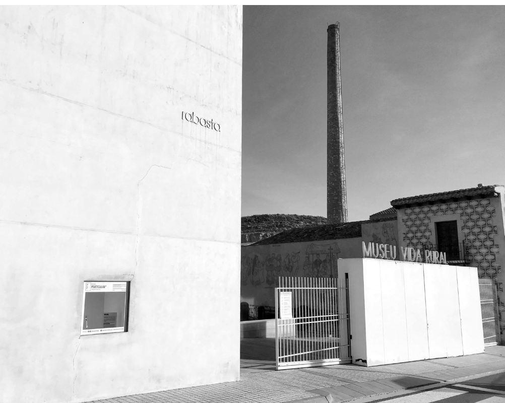
La seu física del Museu particular durant el 2021, a la façana del Museu de la Vida Rural.

Article al digital Bicmi d'Ucraïna, " В Испании открылся музей одного предмета "